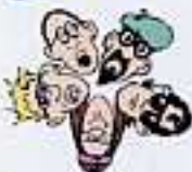
Tavola rotonda: "La sfida educativa"